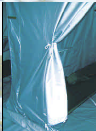
Sovealkov med feltseng • In