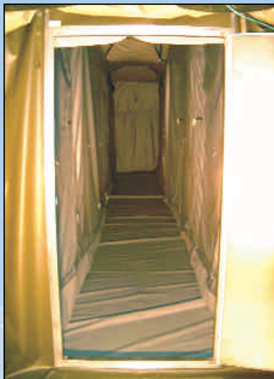
NorLense-telt med sovealkover • No

NorLense-teltet kan leveres med sovealkover.