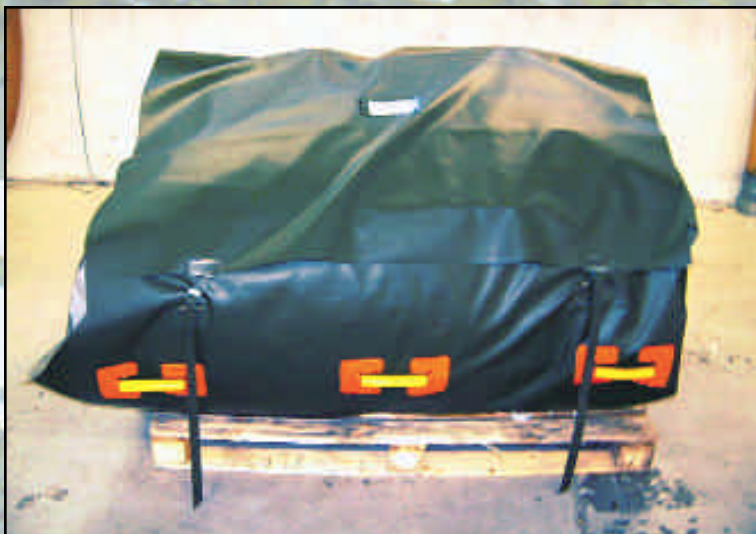
NorLense-telt pakket i bærebag.