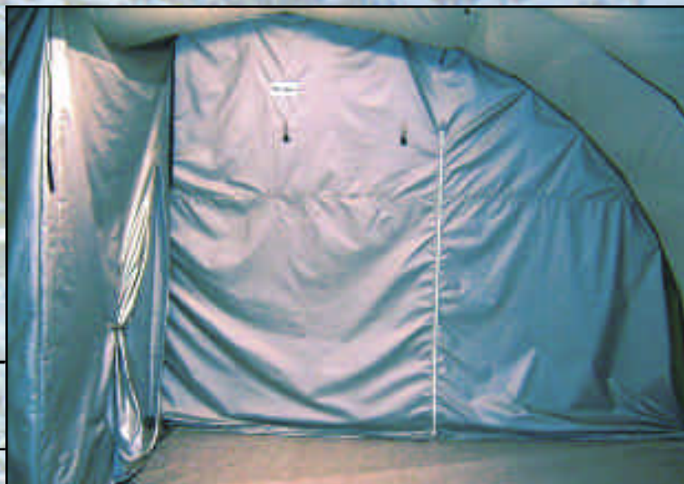
NorLense-telt med skillevegg og sovealkove.