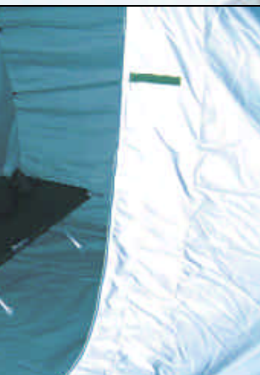
NorLense-telt med innertelt med sideåpning og aluminiumsdør.