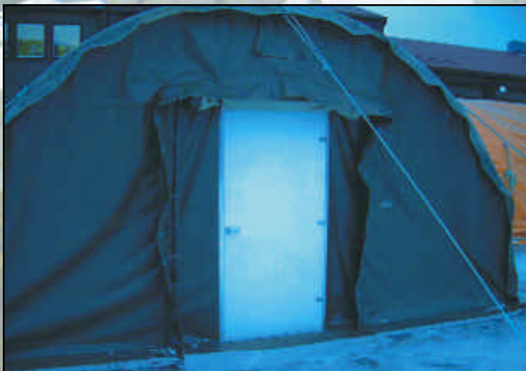
NorLense-telt med aluminiumsdør.